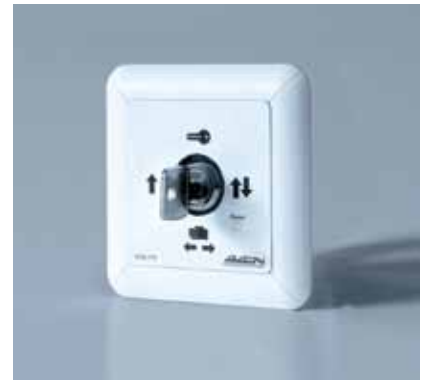
Selector de funciones con llave básico