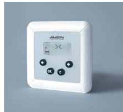
Selector de funciones digital D-Bedix