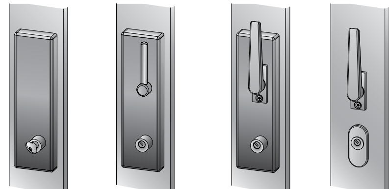
Bloqueo / desbloqueo manual mediante llave, interior y/o exterior