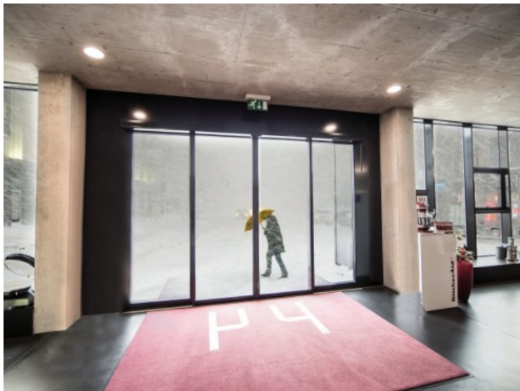
La barrera termoaislante, como solución estética para la entrada