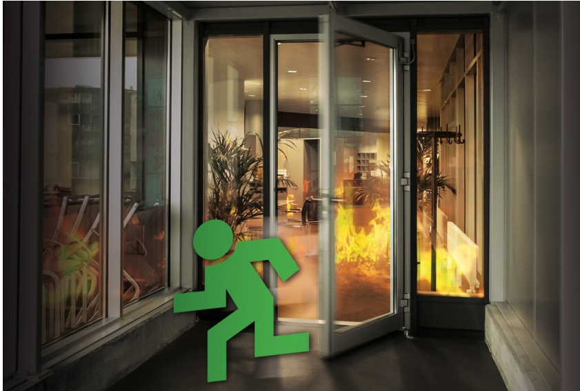
En caso de incendio